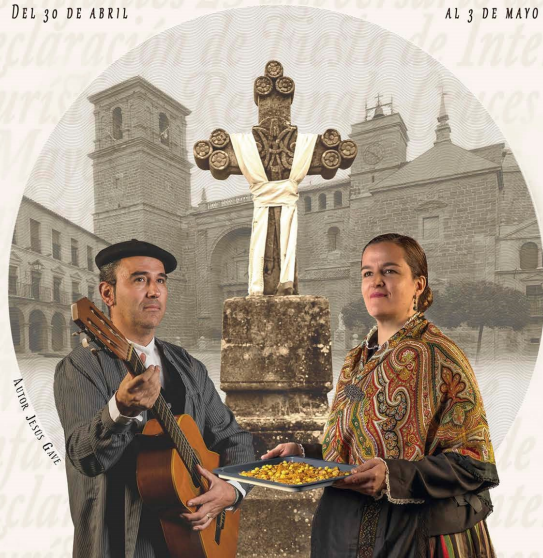
Autor: JESÚS GARCÍA

Villanueva de los Infantes DEL 30 DE ABRIL AL 3 DE MAYO