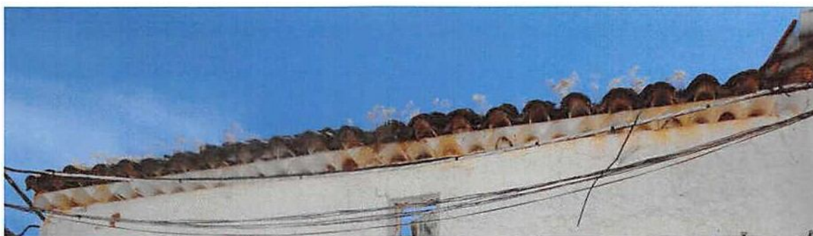
Imagen nº 4. Alero sencillo de una fila, tejado volado sobre alero formando cobijas, sin canales.

Salvo aleros de palacios o casa señoriales o que posean alguna singularidad en su constitución, los aleros se ejecutarán en alguno de los tres tipos siguientes o variaciones (sin solución de continuidad. imágenes nº 4 a 10):