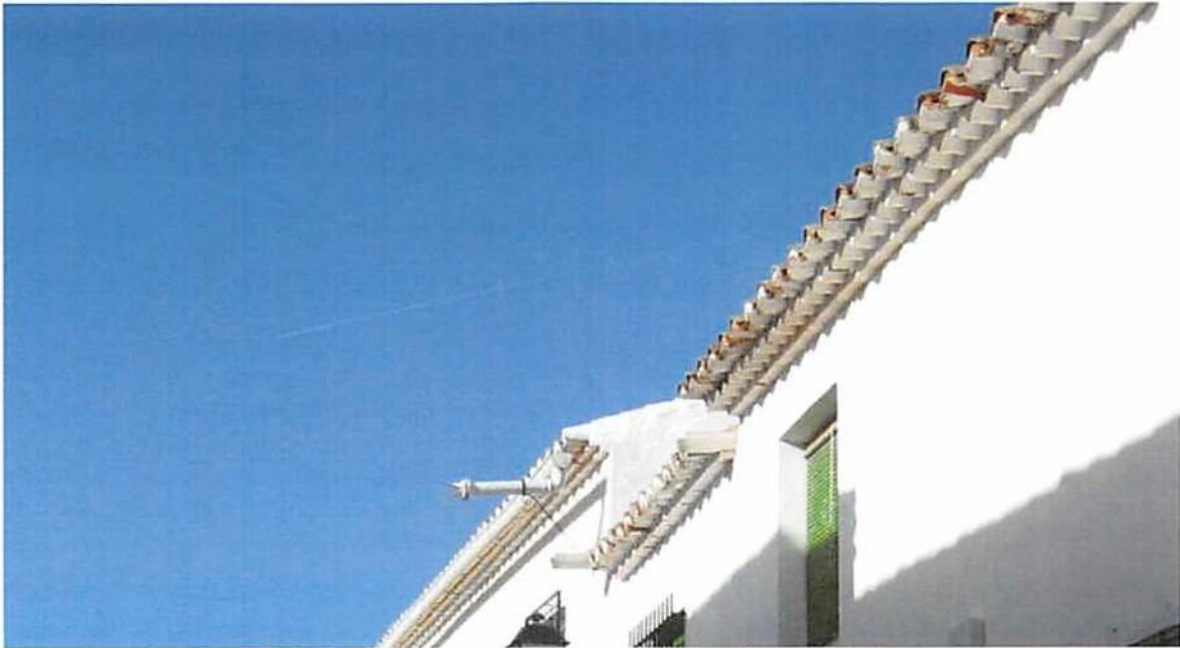
Imagen nº 7. Alero doble, de tejado volado sobre doble fila de ladrillos a testa (izda.) y a la dcha. tejado volado sobre una fila de tejas formando cobijas, sin canales y otra inferior de ladrillo.