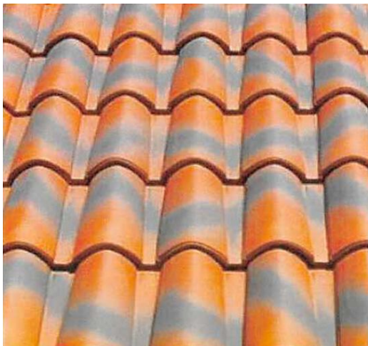
Imagen nº 2. Teja envejecida de imitación (solución no admitida)

No se permitirá la utilización de teja envejecida de imitación con manchas negras uniformes, tipo flameado (imagen nº 2), sino que el envejecimiento será homogéneo (imagen nº 3).