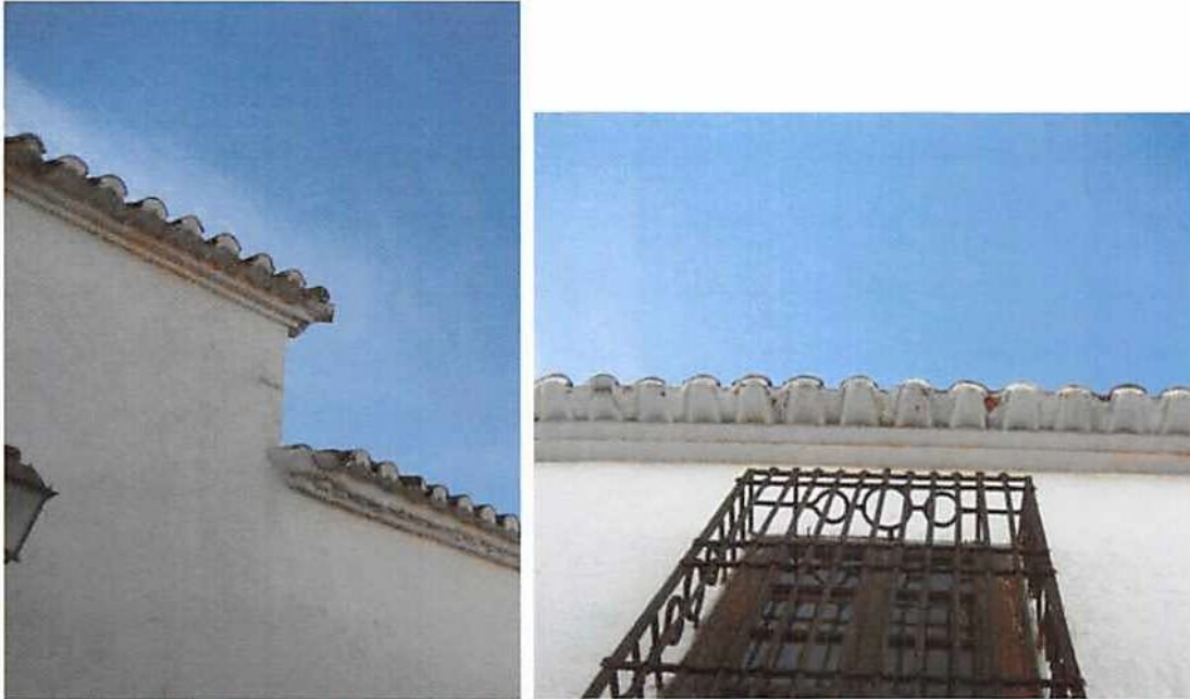
Imagen nº 6. Alero doble: de tejado volado sobre dos hiladas continuas de ladrillo en voladizo una sobre otra.