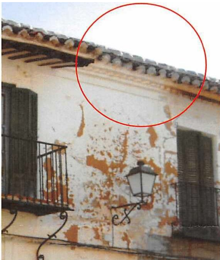
Imagen nº 10. Alero triple formado por una hilada intermedia de ladrillos a testa girados 45° entre dos hiladas continuas.