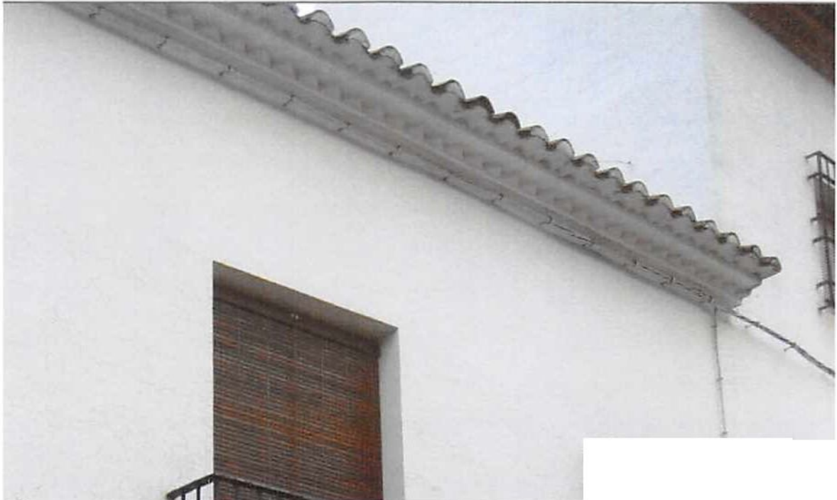
Imagen nº 8. Alero triple: tejado volado sobre hilada continua de ladrillos apoyada en otra de ladrillos a testa girados 45° con remate inferior rasilla).