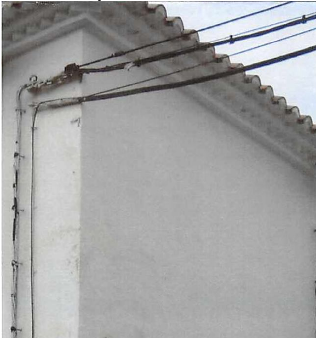
Imagen nº 9. Alero triple con el remate inferior de hilada de ladrillo más grueso.