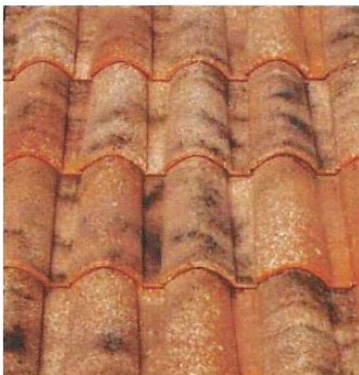
Imagen nº 3. Teja envejecida de imitación (solución admitida)