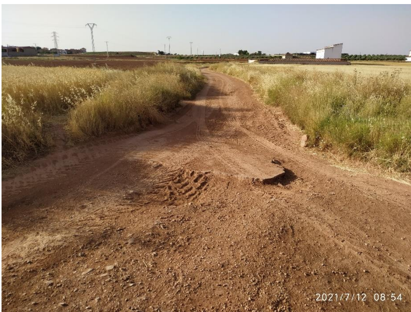
Badén Caminos de las Eras en su encuentro con el Arroyo Pilancón

La Mejora 1 consiste en una actuación a ejecutar en el badén existente en el Camino de las Eras en su encuentro con el Arroyo Pilancón situado aproximadamente en las coordenadas UTM referidas al HUSO 30 (Datum ETRS 89) siguientes: X = 497.864, Y = 4.287.417.