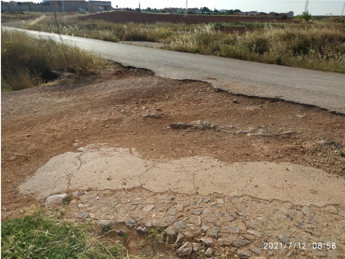
Encuentro Caminos Becerril y Eras

Lo que se estima necesario ejecutar es una excavación para rellenar con piedra y superficialmente ejecutar una rampa de transición con zahorra compactada, para suavizar el paso de un camino a otro y que los vehículos no sufran desperfectos.