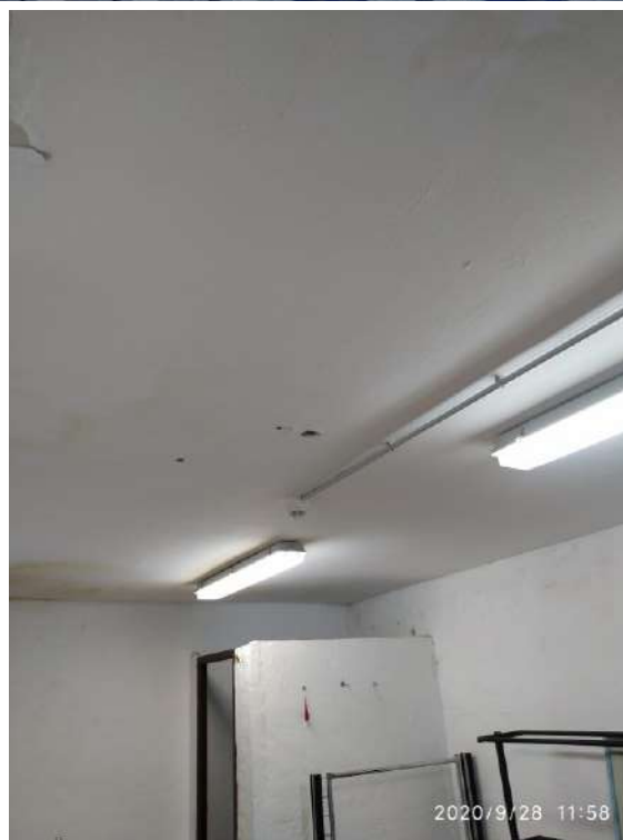
AGUJEROS EN FALSO TECHO